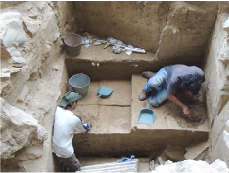
Արագած լեռան լանջին բրոնզե դարի վիշապաքար են գտել (Ֆոտո)