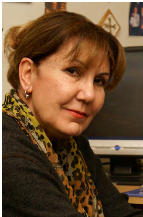
مترجم: اما بگی جانیان

این تن خشکیده که در تابوت بود به تصور من نوعی نیروی غیر ارادی، مافوق طبیعی را به شکلی و به اندازه‌ای می‌بایست در خودش حفظ کرده باشد که در برابر آن خیردار نایستادن غیر ممکن بود، حتی مدتها قبل از ما... در مقابل او پدرشورم، ژنرالی مخوف و جنگ دیده با لباس‌های نظامی و مدال‌ها و نشان‌های مختلف نصب شده بر آن، خیردار می‌ایستاد... او در روستای ما تنها مردی بود و شاید هم