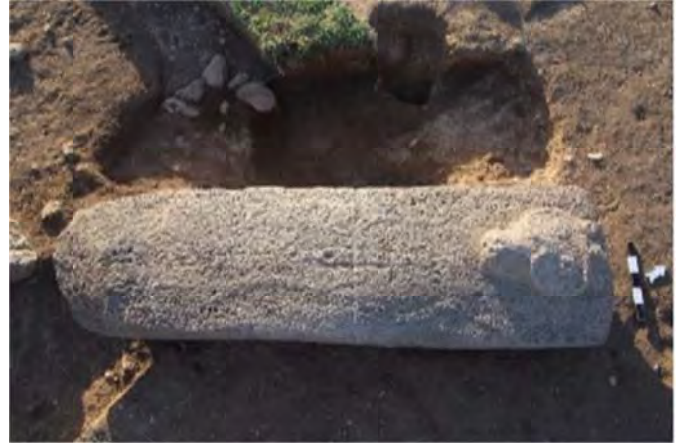
Քարաշամբ՝ բրոնզե դարի եզակի հուշարձան. երբ մեռյալները խոսում են

Արսեն Բորոխյանի խոսքով՝ այստեղ ոչ թե պարզ բնակավայր, այլ հնագույն մետաղագործների ավան է եղել: Պեղումների ժամանակ մ.թ.ա. 3-րդ հազարամյակի շան բրոնզե արձանիկ է հայտնաբերվել: Գիտնականի խոսքով՝ սա եզակի գտածո է, եւ դրա շնորհիվ կենդանաբանները կարող են պատկերացում կազմել նախապատմական շան տեսքի մասին: