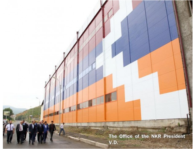
Լուրեր Հայաստանից - NEWS.am

Նախագահին ուղեկցում էին փոխվարչապետ Արթուր Աղաբեկյանը, պաշտոնատար այլ անձինք: