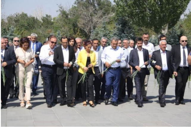
Լուրեր Հայաստանից - NEWS.am

Այցի ավարտին պատվավոր հյուրերը շնորհակալություն են հայտնել կազմակերպիչներին և թանգարանի անձնակազմին՝ միջոցառումը կազմակերպելու գործում ներդրած ջանքերի համար: