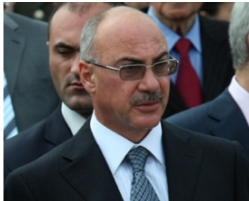
Լեռնային Ղարաբաղի Հանրապետության նախկին նախագահ Արկաղի Ղուկասյանը չի ցանկանում խոսել Կորեայում Մերժ Սարգսյանի հետ բուժման կուրս անցնելու մասին, գրում է NEWS.am -ը:

NEWS.am-ի թղթակցի հետ զրույցում Արկաղի Ղուկասյանն ասել է, որ լավ է, լավ է հանգստացել, սակայն չցանկացավ մանրամասնել, թե ինքը ինչ բուժման կուրս է անցել Կորեայում, ինչքան է արժեցել այն: Նա տեղեկացրել է, որ վաղը մեկնում է եւ ի վիճակի չէ խոսել: «Ես հեռախոսով որեւէ հարցի չեմ պատասխանում, եթե ինչ-որ հարցեր ունեք, գրավոր ներկայացրեք, ցտեսություն», - ասել է ԼՂՀ նախկին նախագահը: