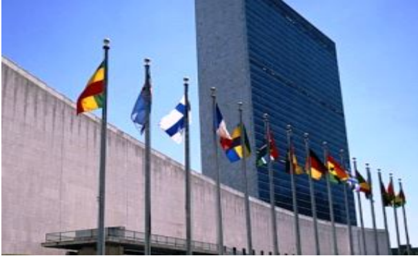
Հունվարի 22, 2014 թ.

Մարտի 22-ին ժնեւում ՄԱԿ-ի Մարդու իրավունքների խորհրդի 22-րդ նստաշրջանում կոնսենսուսով ընդունվել է Հայաստանի նախաձեռնությամբ առաջադրված ցեղասպանության կանխարգելման վերաբերյալ բանաձեւը: Այս մասին նշված է Հայաստանի ԱԳՆ 2013 թվականի հաշվետվության մեջ: