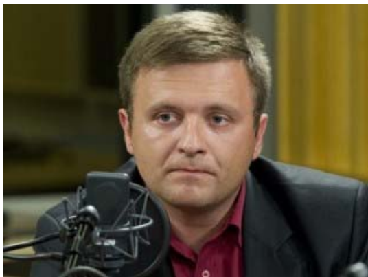
Յունվարի 06, 2014թ.

Թուրքիան Ադրբեջանի գերին է, ուստի Հայաստանի հետ հարաբերությունների հաստատումը եւ ցյուրիխյան արձանագրությունների իրականացումը քիչ հավանական են: Այդ մասին NEWS.am-ի թղթակցի հետ զրույցում հայտարարել է Աշխարհաքաղաքական վերլուծության եվրոպական կենտրոնի գլխավոր տնօրեն, քաղաքական գիտությունների թեկնածու Մատեուշ Պիսկորսկին: