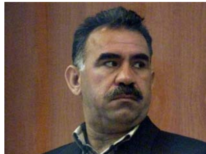
Հունվարի 13, 2014թ.

Թուրքիայի Իմրալը կղզու բանտ այցելած եւ PKK-ի առաջնորդ Աբդուլլահ Օջալանի հետ հանդիպած քրդական «Խաղաղություն եւ ժողովրդավարություն» (BDP) կուսակցության պատգամավորներ Փերվին Բուլքանը, Իդրիս Բալուքեն եւ Ժողովուրդների դեմոկրատական կուսակցության (HDP) պատգամավոր Սըրրը Սուրեյա Օնդերը հրապարակել են Օջալանի հետ անցկացրած հանդիպման մի քանի մանրամասներ: