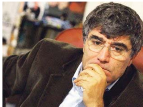
Յունվարի 20, 2014թ.

«Հրանտ Դինքի սպանության 2015-ի հեռանկարին» ոգեկոչման ֆորումի ժամանակ 15 կետանոց պահանջ է ընդունվել: