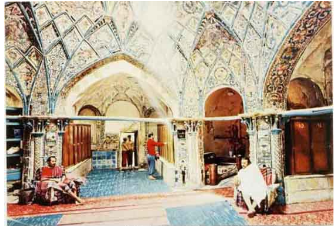
گرمابه چهار فصل ۱۳۵۵

Այս քառեակ բաղանիքը, քաղաքի պատմական տեսարժան վայրերից մէկն է, որը ներկայացնում է որպէս թանգարան, կոթող: