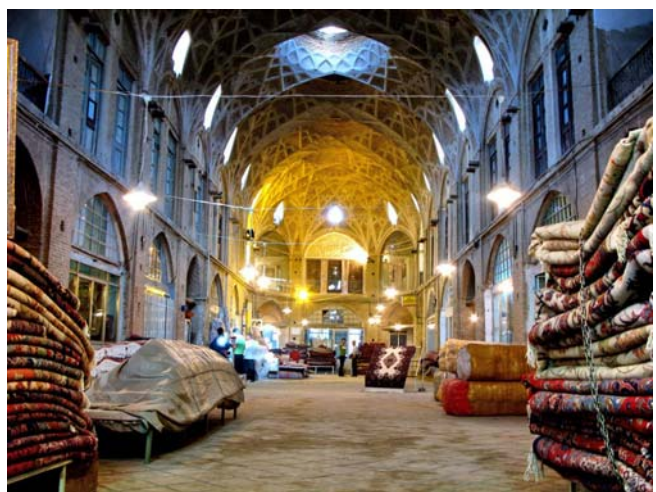
Շուկայից և իր հարակից շէնքերից նմուշներ: