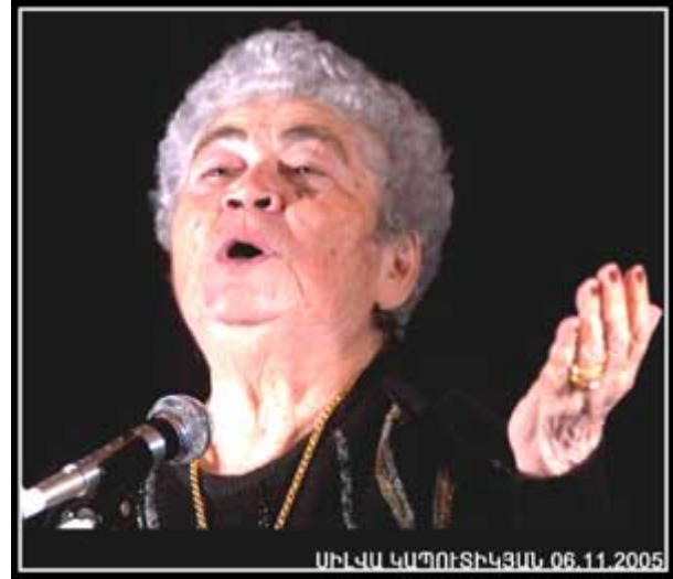
ՍԻԼՎԱ ԿԱՊՈՒՏԻԿՅԱՆ 06.11.2005

ցավակցությունն են հայտնում բանաստեղծուհու հարազատներին եւ նրա արվեստի բազմահազար երկրպագուներին»: