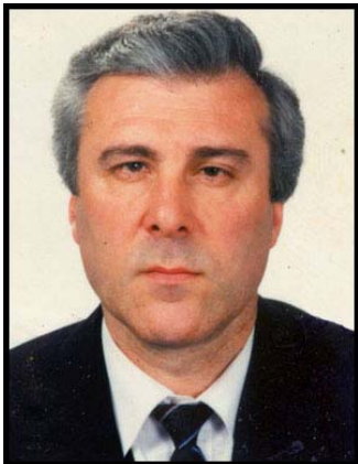
2004թ. Նոյեմբերի 23-ի առավոտյան,

Հանրապետական հիվանդանոցի վերակենդանացման բաժանմունքում վախճանվեց մեր ժամանակների խոշոր սեյսմոլոգներից մեկը՝ պրոֆ. Սերգեյ Բալասանյանը: Նա հիվանդանոց էր տեղափոխվել նոյեմբերի 19-ին: Նույն օրը Աշտարակի խճուղու վրա, Գյումրիում դասախոսություն կարդալուց հետո, վերադարձի ճանապարհին, չպարզված հանգամանքներում ենթարկվել էր ավտոկթարի, որի մասին մեր թերթը գրել էր երեկվա համարում: Դեռ շատ կգրվի այս խոշոր գիտնականի մասին, որի վաստակը մեծ է ոչ միայն հայկական, այլև համաշխարհային սեյսմոլոգիայի ասպարեզում: Մինչ այդ, ստորեւ ներկայացնում են