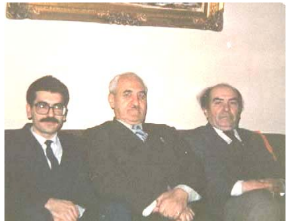
Աջից՝ Յ. Մինասեան, Հով. Էդգարեան, Էդ. Գերմանիկ

Իրանահայ անլանի գեղանկարիչ, ծովանկարիչ, մտատրական Յարութիւն Մինասեանը իր մահկանացուն կնքեց երկուշաբթի, յուլիսի 29-ին՝ Թեհրանի իր բնակարանում: