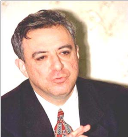
2002 թ. մայիսի 27-28-ը Երեւանում կայանալու է Հայաստան - Սփյուռք երկրորդ խորհրդաժողովը: Ինչպես եւ 1999 թ. սեպտեմբերին տեղի ունեցած անդրանիկ խորհրդաժողովի ժամանակ, ակնկալվում է, որ համահայկական այս երկրորդ հավաքին կմասնակցեն Հայաստանից եւ 50 արտասահմանյան երկրներից շուրջ 1000 մարդ, որոնց նպատակն է ի մի բերել Հայաստանի եւ Սփյուռքի ներուժը: Հայաստանի, Լեռնային Ղարաբաղի եւ Սփյուռքի քաղաքական ու եկեղեցական առաջնորդները կդիմեն խորհրդաժողովի մասնակիցներին: ՀՀ արտաքին գործերի նախարար Վարդան Օսկանյանը պատասխանում է խորհրդաժողովի նպատակների, խնդիրների եւ ձեռնարկի վերաբերյալ «Ազգի» հարցերին:

տանից եւ 50 արտասահմանյան երկրներից շուրջ 1000 մարդ, որոնց նպատակն է ի մի բերել Հայաստանի եւ Սփյուռքի ներուժը: Հայաստանի, Լեռնային Ղարաբաղի եւ Սփյուռքի քաղաքական ու եկեղեցական առաջնորդները կդիմեն խորհրդաժողովի մասնակիցներին: ՀՀ արտաքին գործերի նախարար Վարդան Օսկանյանը պատասխանում է խորհրդաժողովի նպատակների, խնդիրների եւ ձեռնարկի վերաբերյալ «Ազգի» հարցերին: