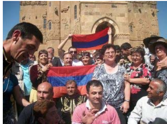
Սեպտեմբեր 10, 2012

Նախորդ տարիների համեմատ պատարագին մասնակցողների թիվը զգալի պակաս էր, սակայն այս տարի Աղթամարում էին գտնվում ավելի շատ հայաստանցիներ քան Նախորդ երկու տարիներին: Եթե առաջին տարում պատարագին մասնակցել էր մոտ 50 հայաստանցի, այս տարի պատարագին մասնակցող հայաստանցիների թիվն անցնում էր 300-ը: Այս տարի ԱՄՆ-ից եւս հայերի մեծ խումբ էր եկել՝ մոտ 70 հոգի: Հետաքրքիր էր նաև, որ պատարագին ժամանել էին նաև հայեր Դիարբեքիից, Մուշից եւ Սասունից: Պատարագի շատ մասնակիցներ հուզվել էին եւ չէին կարողանում թաքցնել արցունքները: Պատարագից հետո եկեղեցում Հայաստանից ժամանած քահանայի ղեկավարությամբ տեղի ունեցավ երկու հայաստանցի երեխաների մկրտություն: