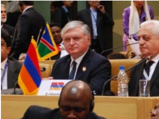
Օգոստոս 31, 2012 | 20:19

Օգոստոսի 30-31-ը Թեհրանում տեղի ունեցավ Չմիացած երկրների շարժման 16-րդ գագաթաժողովը, որին ներկա էին կազմակերպության 120 անդամ եւ 17 դիտորդ երկրների բարձրաստիճան պատվիրակությունները, ՄԱԿ-ի Գլխավոր քարտուղարը: