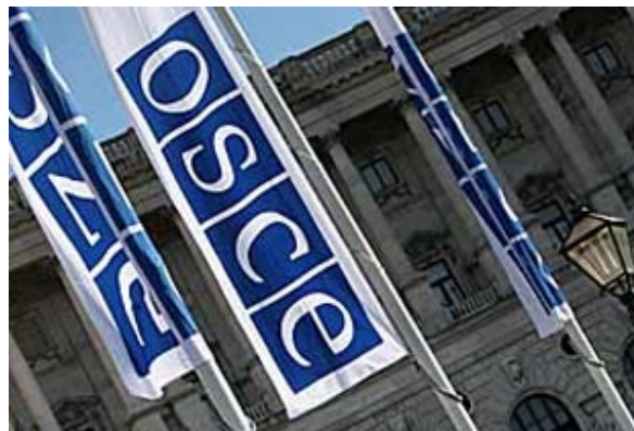
Հուլիս 20, 2012

ԵԱՀԿ Մինսկի խմբի համանախագահները, որոնք հանդես են գալիս որպես միջնորդ դարաբաղյան կարգավորման գործընթացում, հուլիսի 20-ին հայտարարություն են տարածել Լեռնային Ղարաբաղում կայացած նախագահական ընտրությունների վերաբերյալ: