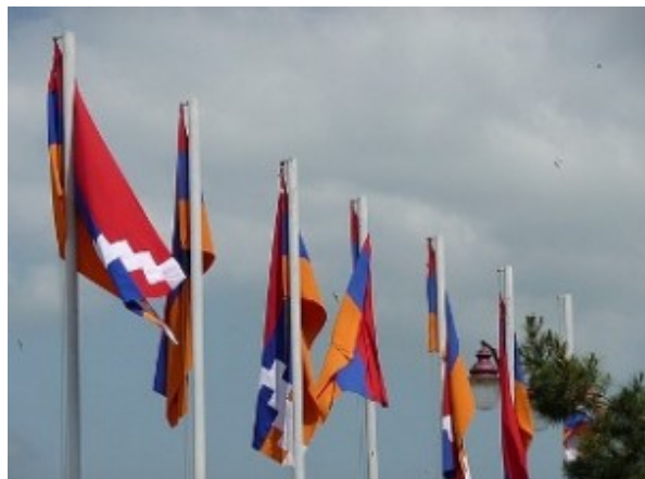
Հուլիս 19, 2012

Լեռնային Ղարաբաղի հանրապետությունում նախագահական ընտրությունների ընթացքում նույնիսկ ամենափոքր գյուղերում ընտրատեղամասերը հագեցած են համապատասխան պարագաներով եւ պայմաններով: Այս մասին այսօր՝ հուլիսի 19-ին, Ղարաբաղում լրագրողների հետ գրույցում նշել է Սովորական քաղաքացիների կուսակցության առաջնորդ, Stop Islamization of Europe միջազգային կազմակերպության խորհրդի անդամ, Բուլղարիայի խորհրդարանի պատգամավոր Պավել Չերնեւը: