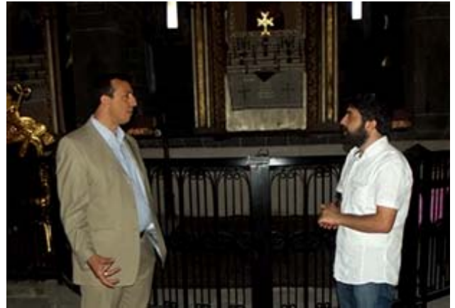
Օգոստոս 07, 2012

Թուրքիայի հարավ-արեւելքում գտնվող Դիարբեքի քաղաքում ստեղծում է մշակութային փողոց, որտեղ տեղ կգտնեն հայկական, առաքական եկեղեցիներ, հրեական սինագոգ, մզկիթ եւ պեղինների հոգեւոր տուն ջեմելի: