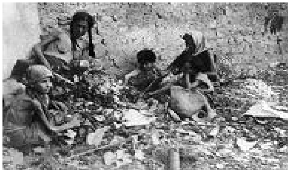
19-4-2012- Haber Türk-ի փոխանցմամբ՝ ապրիլի 12-ին ՄԱԿ-ում կազմակերպված «Հայոց ցեղասպանության

«1915 թվականի դեպքերի համար հայերը պահանջում են 15 միլիարդ դոլարի փոխհատուցում». թուրքական մամուլ