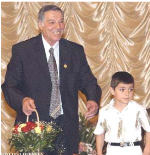
Ալբերտ Ազարյանին հուզում է մարզաձեռի մասսայականության հարցը

Լրացավ օլիմպիական խաղերի եռակի չեմպիոն, աշխարհի, Եվրոպայի եւ ԽՍՀՄ առաջնությունների բազմակի չեմպիոն Ալբերտ Ազարյանի ծննդյան 80-ամյակը: Չնայած պատկառելի տարիքին, օղակների արքան շարունակում է իր ակտիվ մարզական գործունեությունը: Նա իր անունը կրող մարզական դպրոցի տնօրենն է: 1956-ին Մելքունի օլիմպիականում Ալբերտ Ազարյանը ոսկե 2 մեդալ նվաճեց. մեկը՝ ԽՍՀՄ հավաքականի կազմում թիմային հաղթանակի, մյուսը՝ օղակների վրա վարժությունում հաղթող ճանաչվելու համար: Չորս տարի անց Հռոմում կայացած օլիմպիական խաղերում նա կրկնեց հաջողությունը՝ կրկին լավագույնը ճանաչվելով օղակների վրա կատարած վարժությունում, թիմային պայքարում էլ