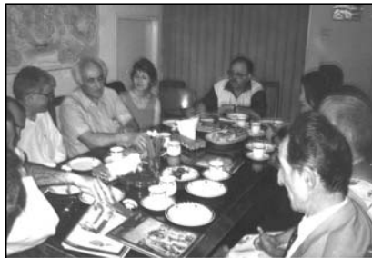
«Շարժ Ազնաւորի» թատերախումբը «Լոյսի» գրասենեակում:

Լոյս. Նախ թոյլ տւէք «Լոյս» երկ- շաբաթաթերթի անունից շնորհա- կալութիւն յայտնել՝ Ձեր ժամանակը մեզ տրամադրելու համար: